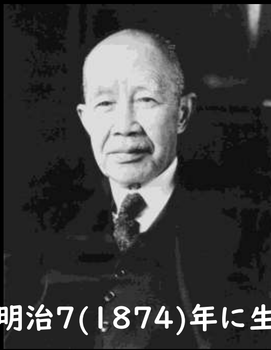
浪平翁は明治7(1874)年に生まれました