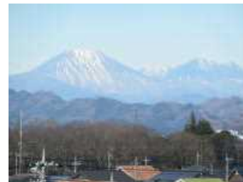
4階図書室から見た雪の男体山