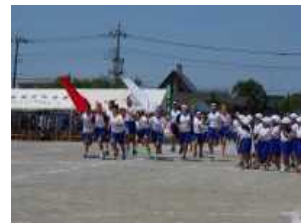
5・6年「合小ソーラン」力走！紅白リレー