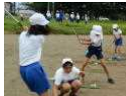
ターゲットバードゴルフ

7月21日(木)毎年恒例、都賀地区3校の6年生による、スポーツ交流会が開催されました。3校で事務局を持ち回り、その年の事務局になった学校が、当日の運営などを中心に行いますが、今年は合戦場小が当番。運動委員会の児童を中心に、開・閉会式や準備運動など、堂々と進行していました。競技自体も、ターゲットバードゴルフやユニホックなどのニュースポーツに親しむことが出来ました。また、勝敗にこだわることなく、来年は都賀中で一緒になるであろう、より多くの友達と親睦を深め、有意義な時間を過ごすことが出来ました。