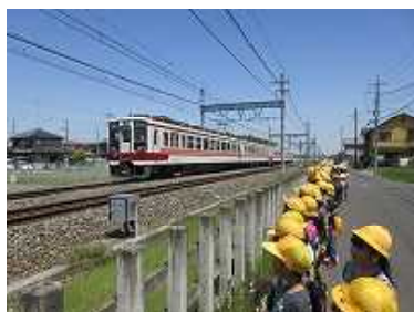
↑ 3年生 ↓ 4年生