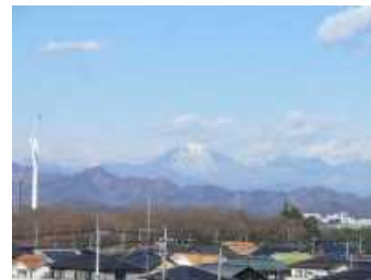
4階図書室から見た雪の男体山