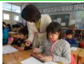
3年珠算ボランティア

昔遊び体験やジャガイモの植付け、珠算教室、視覚障がい者の方の話、水俣病患者の方との交流など、2月も大勢の地域の皆様にお力をお貸