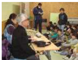
4年視覚障がい者の方の話

しいたいて、学習活動を進めることができました。おかげで、子どもたち一人一人の学びに広がりや深まりをもたせることができました。また、読み聞かせや放課後教室なども2月で最終回を迎えましたが、改めてたくさんの皆様のご支援に感謝いたします。