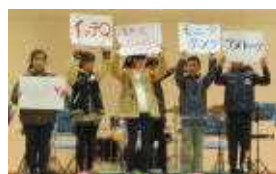
6年生クイズ(好きな番組は?)