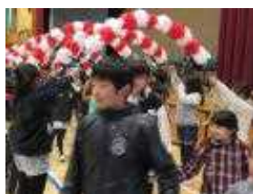
大きな拍手の中6年生入場

きれいに飾り付けられた体育館。6年生に関する楽しいクイズビンゴ。なかよし班でのふれあいカルタ。6年生への心のこもったプレゼント。そして鳴りやまない拍手。2月22日(水)に6年生を送る会が、児童会主催で開かれました。この1年間、合戦場小のリーダーとして、様々な活動の中心となって活躍した6年生。下級生の良い手本であり、あこがれでした。そんなお世話になった6年生に、在校生全員で「ありがとう」の感謝の気持ちを送ることができました。企画・運営の中心となった5年生も、精一杯取り組み、伝統のバトンをしっかり受け継ぐことができたようです。また、その日は給食もなかよし班で食べ、昼休みも一緒に遊び、6年生とたくさんふれあうことができました。