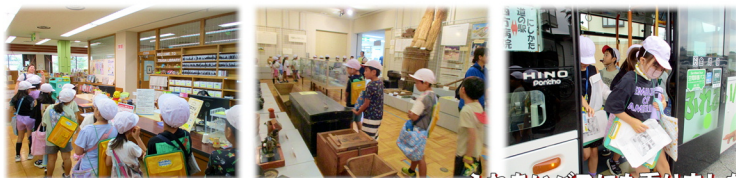
ふれあいのバスにも乗りました

都賀図書館は9月末で休館になりました。最後に、長い間地域に親しまれてきた姿を、見届けることができました。