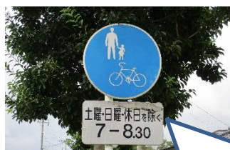
正門付近と県道からの入り口に「歩行者専用」

知らないで通ってしまった方、これからは平日の朝決まった時間だけ通らないようにお願いします。