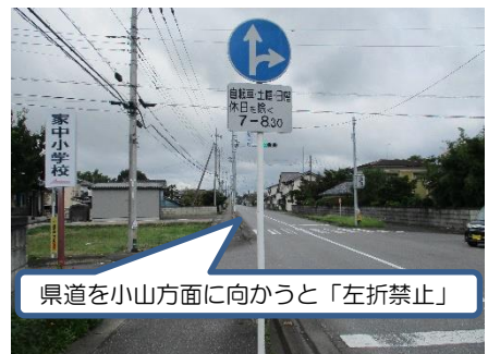
県道を小山方面に向かうと「左折禁止」