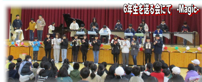
6年生を送る会にて -Magic-