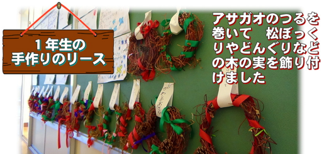
1年生の 手作りのリース

アサガオのつるを 巻いて 松ぼっくり りやどんぐりなど の木の實を飾り付 けました