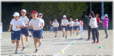
5・6年生は新コースの下見の際、道端のゴミ拾いもしました。新たな伝統になるかも知れません。