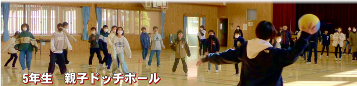
5年生 親子ドッチボール

親子活動では、子供たちの安心した笑顔や大人の偉大さに目を丸くする様子が見られ、充実した時間となりました。お忙しい中ご参加くださり、ありがとうございました。