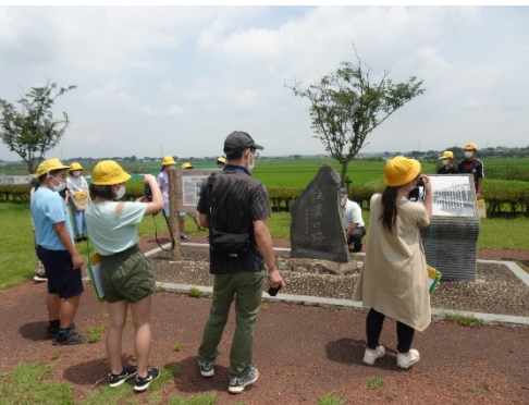
水害についてのフィールドワーク