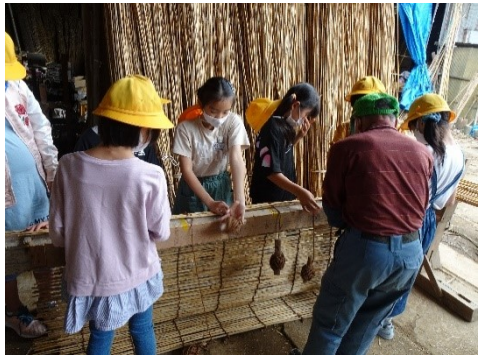
よしずづくり体験