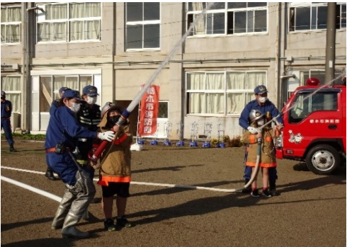
消防団による消火訓練体験