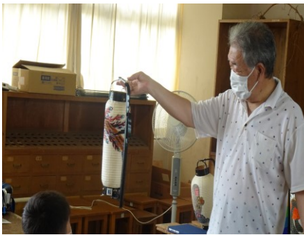
ちょうちんづくり