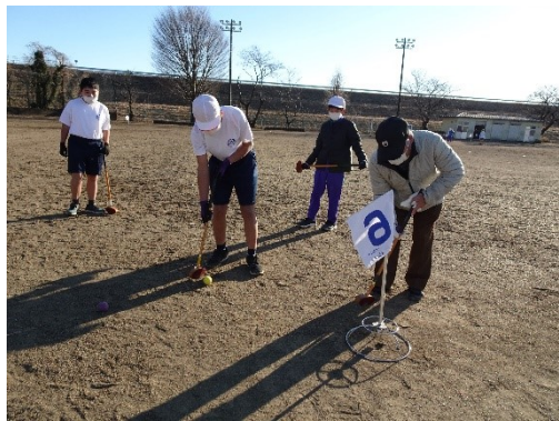
グラウンドゴルフ体験