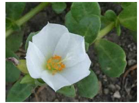
ポーチュラカ 校舎前花壇