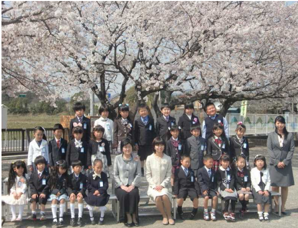
1年2組 25名 (男子10名 女子15名)