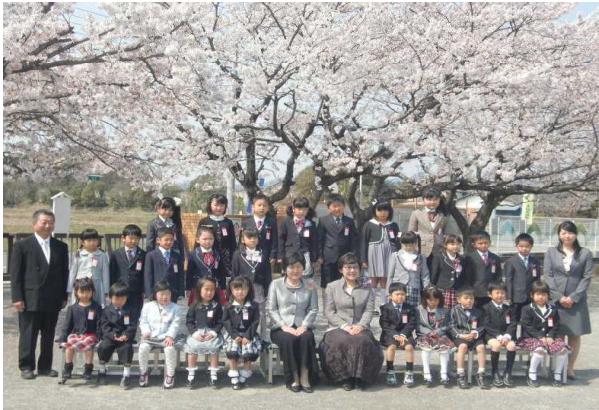
1年1組 26名 (男子10名 女子16名)