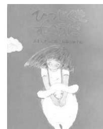
『ひつじぐものむこうに』

白くなりたい！まっ白いひつじのむれ の中で一ぴきだけ黒くて小さなクロは いつも思っていました。そのクロがみんなをたすけようとして大かつやく！