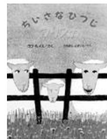
『ちいさな羊フリスカ』

フリスカはちいさなひつじの 女の子。いつもちいさいことでからかわれ、悲しくてたまりません。でも、体がちいさいほうが、いいことだってあるんです。