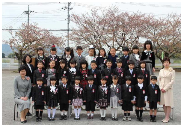
1年1組 30名 (男子12名 女子18名)