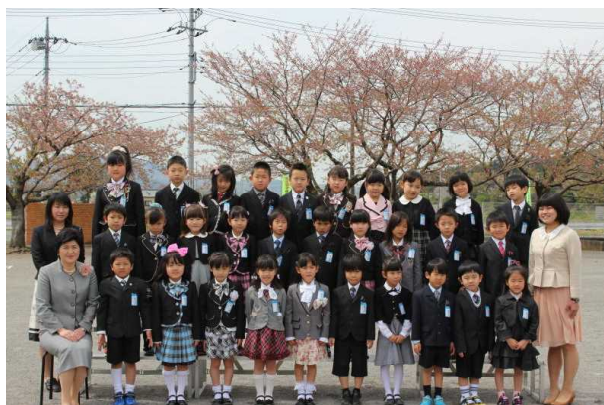
1年2組 30名 (男子13名 女子17名)