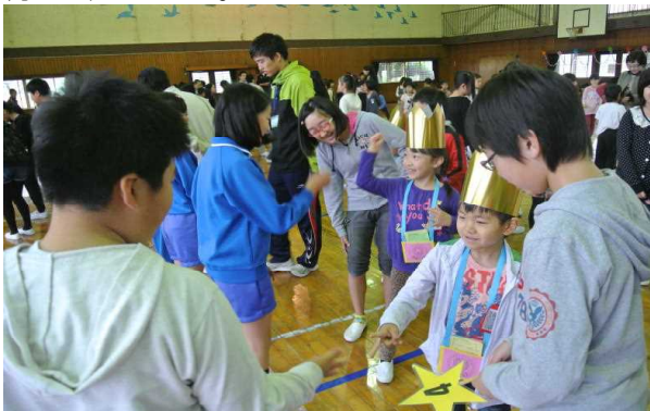
「じゃんけんゲーム」で仲間入りです。

「1年生を迎える会」には、今年も「いとひばくん」が登場しました。クイズの中で、大きないとひばの木の他に、2本の若いいとひばの木が植えてあることが分かりました。