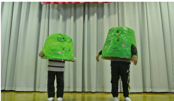
吹上小マスコット「いとひばくん」

「1年生を迎える会」には、今年も「いとひばくん」が登場しました。クイズの中で、大きないとひばの木の他に、2本の若いいとひばの木が植えてあることが分かりました。