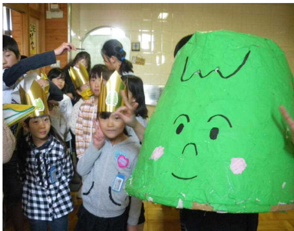
「いとひばくん」です ↑