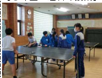
【卓球クラブの活動】

児童は、授業の後、クラブ活動も実施し、中学生との貴重な交流の時間となりました。この活動は小中一貫教育の取組の一つとして、昨年度からスタートした活動です。今後も様々な機会を設け、小中9年間の学びを見通した小中学校間の子どもたちの交流を推進していきます。