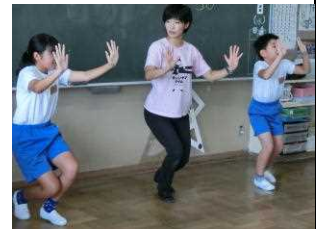
【パントマイムに挑戦する6年生】

11月に実施する文化芸術による子どもの育成事業に先立ち、パントマイムのグループ、カンジヤマ・マイムからお二人においでいただき、5・6年生がパントマイムを体験しました。子どもたちは、はじめは緊張した様子でしたが、分かりやすいご指導で少しずつ表現が上手になり、楽しくワークショップに参加することができました。11月30日の本公演では、保護者の皆様にも案内状をお配りしますのでぜひご参加ください。