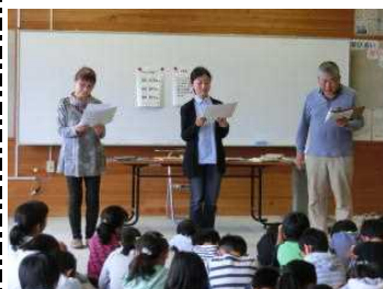
【りんごの会の皆様の読み聞かせ】