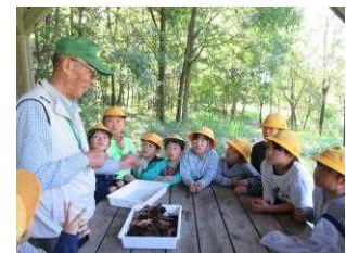
【カブト虫の幼虫の説明を聞く児童】

○ 校外学しゅうで、くまこん虫の森に行きました。わたしは、水ポイントのところに行って、かにを見ました。かにをさわろうとしたら、かにの手にあるはさみではさまれそうになったので、びっくりして水の中にもどしました。またこん虫の森に行って、かにを見たいです。