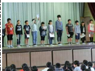
【図書委員会による読書集会】

毎月第3日曜日の「吹上小うちどくの日」以外でも、時には、テレビ・ゲームを消して、家族みんなで読書に親しむ時間を持てるといいですね。