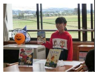
【図書委員によるブックトークミニ】