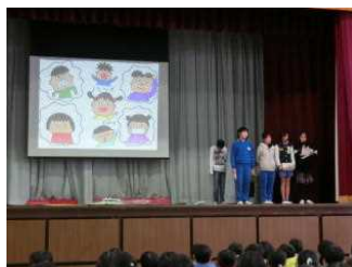
【給食委員による栄養の話】