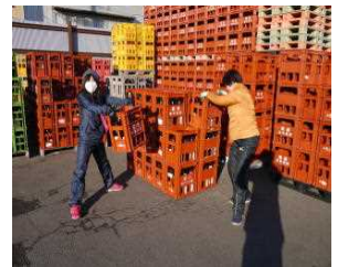
【関口空堀での瓶類の回収】