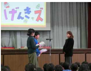
【調理員さんへのプレゼント】

給食週間には、給食に関する作文や標語、ポスターの作成を行いました。また、6年生が家庭科の学習で献立を作り、献立コンクールを実施しました。入賞した献立は、3月の給食に取り入れられます。22日には、調理員さんを招待して、給食委員会による給食集会を開きました。調理員さんへの感謝の気持ちを込めて全校児童で「えいよの歌」を歌い、手作りの給食カレンダーを贈呈しました。