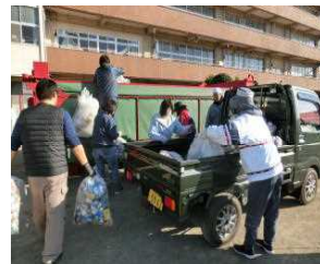
【学校でのアルミ缶回収】