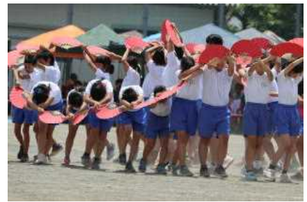
【高学年ダンス：令和～走り出そう未来へ～】

「最後までがんばろう！燃えろ吹上 目指せ優勝」のローガンのもと、春季大運動会を開催しました。多くのご来賓の皆様、保護者・地域の皆様にご観覧いただく中、子どもたちは、これまでの練習の成果を十分に発揮し、最後まで全力で演技をすることができました。保護者の皆様には、前日の準備から当日の応援や競技への参加、そして片付けまで、たくさんのご支援・ご協力をいただきましたことに、心より感謝いたします。ありがとうございました。