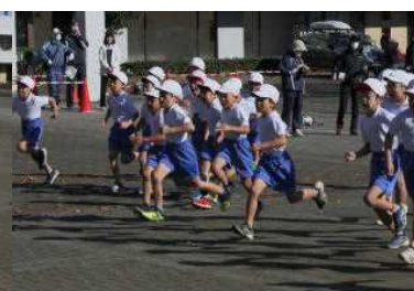
【全力で走った 持久走大会】