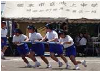
1年 吹中タイフーン