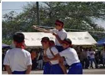
2年 吹中ローハイド