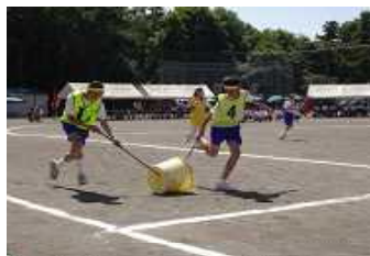
2年 コロちゃんリレー