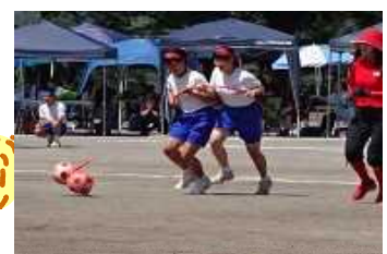
3年 進路は運まかせ