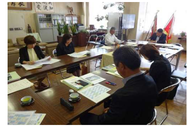
熱心に協議を行う委員の皆様