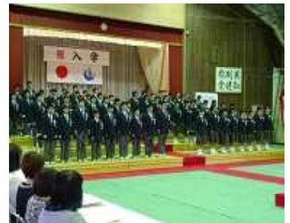
入学式 - 64名の新入生

入学式では、64名の新入生を迎えました。背筋をぴんと伸ばし、担任の呼名に大きな声で返事をする新入生の姿は、これから始まる中学校生活への意欲や期待にあふれており、頼もしさを感じました。全校生合わせて213名、力を合わせて、また新しい吹上中の歴史をつくっていきます。