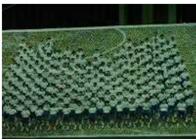
モザイクアート「いぶリンピック」