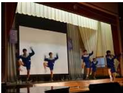
ダンス「華・奏・舞・心」

今年も生徒が意欲的に活動し、素晴らしい発表や展示が見られました。まさに生徒一人一人が躍動し、光輝く、「笑顔と感動あふれる」学校行事になりました。売店やバザー等で御協力いただいたPTA役員の皆様、親父の会の皆様、ありがとうございました。また、御来賓の皆様をはじめ保護者の皆様、地域の皆様、多数御来校いただきありがとうございました。