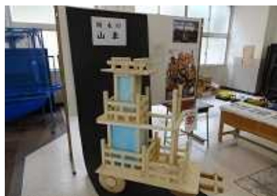
立体模型「栃木の人形山車」