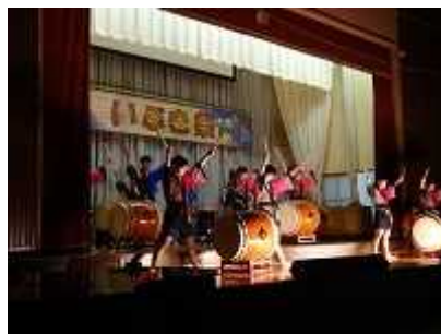
和太鼓「三宅・屋台囃子・八丈・風車」