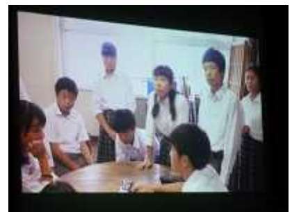
劇映画「愚者のエンドロール」