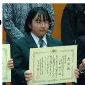
社会を明るくする 運動作文 栃木県知事賞 〇〇 〇〇 さん