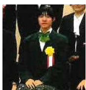
税についての作文 栃木法人会長賞 〇〇 〇〇 さん