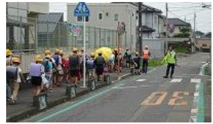
7/10 安全ボランティア統一行動日

ようやく梅雨も明け、本格的な夏の訪れとなりました。今年も大変暑い1学期でしたが、71日間(1年生は70日間)、おかげさまで子どもたちは元気いっぱい、無事に学期末を迎えることができました。暑さの中、子どもたちの健康・安全を守るため、また楽しい授業支援のため、保護者の皆様、安全パトロール、交通指導員、アシストネット、PTAの活動(Sサポ)など、多くの地域の皆様のご協力をいただきました。深く感謝申し上げます。