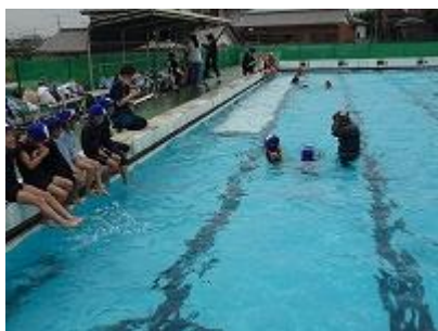
7/11 1・2年生水泳記録会

今年のプールは、Sサポの保護者の方が授業支援、見守りに入ってくださいました。子どもたちも暑い時期のプールは楽しみの一つですが、教職員は子どもたちを指導しながら、安全面の配慮をするため、多くの目があることはたいへんありがたかったです。全学年とも、見守りの中、水泳記録会を終えることができました。今年の目標は達成できたでしょうか。また来年ですね。