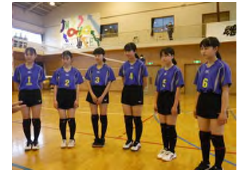
女子バレーボール