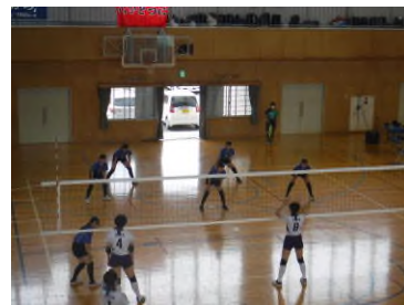
女子バレーボール