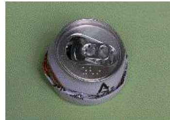
<縦につぶした悪い例>