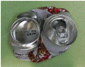
<横につぶした良い例>