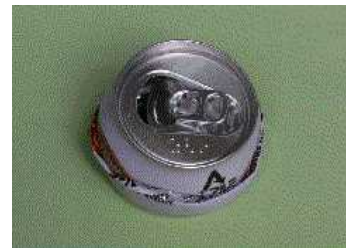
<縦につぶした悪い例>

ポイント1 アルミ缶を分別する場合には、缶に印刷されているリサイクルマークで確認する。