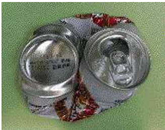
<横につぶした良い例>