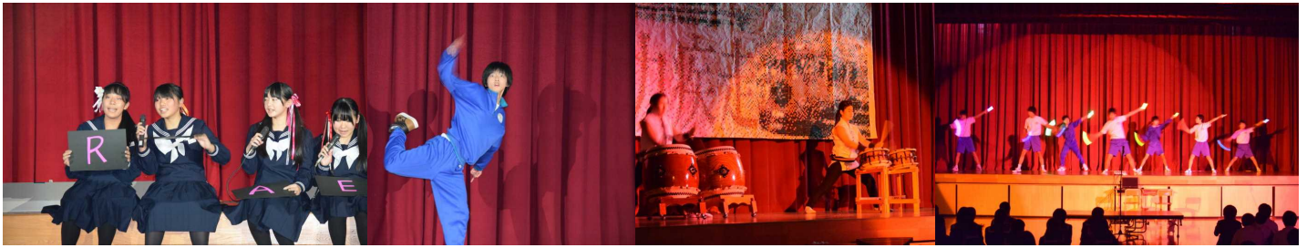
↑ [ダンス・太鼓・おた芸]