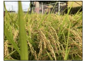
正門北側 水田の稲穂

残暑厳しいスタートとなりましたが、熱中症や感染症には十分配慮し、一人一人の意識を高めながら教育活動を充実させていきたいと考えています。徐々に生活リズムを整え、十分な睡眠と健康管理へのご協力を引き続きよろしくお願いいたします。