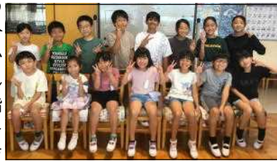
ありがとうの友達(7月)

夏休み前に、7月の「ありがとうの友達」を、給食時の放送で紹介しました。カードには、友達の「よいところ」や「ありがとう」がたくさん書かれています。これからも、目指す子ども像「互いのよさや努力を認め合い、思いやりのある子」を育てていきたいと思ひます。