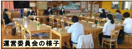
運営委員会の様子