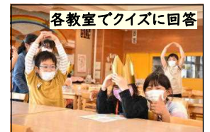
各教室でクイズに回答

これからも計画的にWGを生かした活動を取り入れ、もっともっと子どもたち同士がかかわり合い、仲良くなって、絆を深めていきたいと思います。