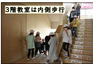
3階教室は内側歩行

5月6日(金)、今年度最初の避難訓練を実施しました。今回のねらいは、①避難経路②避難場所の確認です。進級・入学後の新しい教室から、避難場所までの経路を確認しました。子どもたちは、真剣に参加していました。「おさない・かけない・しゃべらない・もたない・もどらない・ちかづかない」や「放送をしっかりと聞いて、状況を確認して行動する」等について指導しました。