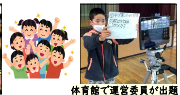
体育館で運営委員が出題

4月26日(火)に「1年生を迎える会」を行いました。感染症拡大防止対策として、2部制にする工夫をしました。