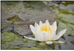
学校の池のハスの花

一斉に萌えだした淡い若葉が日ごとに色を深め、校庭の木々や花壇の景色も少しずつ変わってきました。子どもたちは、進級した学年の生活に慣れ、落ち着いて過ごしています。