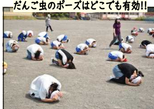
だんご虫のポーズはどこでも有効!!