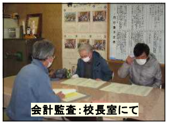
会計監査：校長室にて

2月25日(金)に教育振興会の役員会を開催する予定でしたが、まん延防止等重点措置発令中のため、会計監査のみの実施とさせていただきました。振興会は、千塚小学校の教育振興を図ることを目的として、地域の自治会長様が役員を務められている団体です。今年度の会長は千塚町の[ ]様、令和4年度の会長は宮町の[ ]様です。今年度も学校及びPTA関係の文書回覧や配付を行っていただき、お世話になりました。また、多くの児童用図書や花苗や鉢花などを購入して教育環境を充実させることができました。タッチペンやソフトウェア等を購入し、リモートでの集会やタブレットでの学習を進めることもできました。他にも、ミシンの点検修理やストップウォッチ、サッカーボール、ハンドベルなども購入させていただきました。地域あつての千塚小です。ご支援に感謝申し上げます。決算報告と支出内訳については、PTA総会資料に綴じ込みご報告いたします。ありがとうございました。