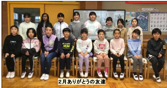
2月ありがとうの友達