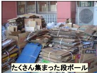
たくさん集まった段ボール