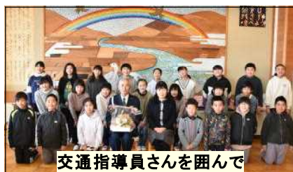
交通指導員さんを囲んで