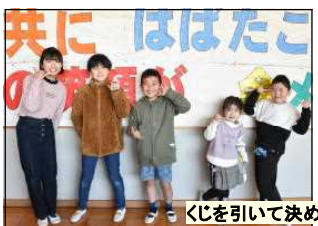
くじを引いて決められたポーズで

6年生が好きな給食のメニューは? 1. ココア あげパン 2. からあげ 3. カレー