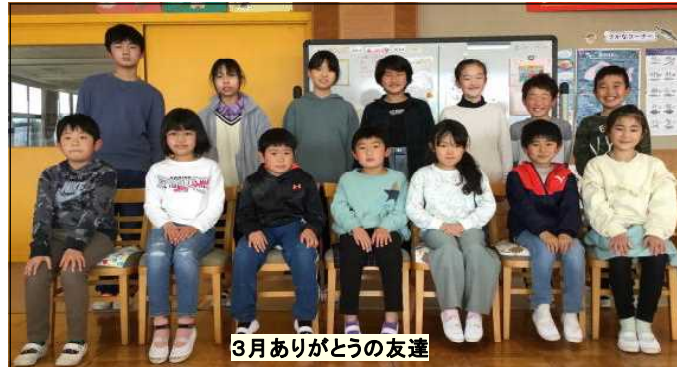
3月ありがとうの友達