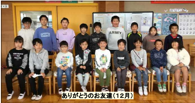
ありがとうのお友達(12月)

冬休み前に、12月の「ありがとうのお友達」を、給食時の放送で紹介しました。子どもたちは、自分の名前が呼ばれ、カードに書かれた「よいところ」や「ありがとう」の内容が紹介されると、とても嬉しそうにしています。これからも、目指す児童像「互いのよさや努力を認め合い、思いやりのある子」を育てていきたいと思ひます。