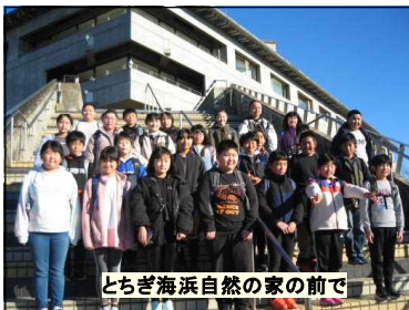
とちぎ海浜自然の家の前で

12月13～15日に2泊3日で、臨海自然教室を実施しました。2日目には、吹上小との合同プログラムも行われ、海の自然を満喫しながら、交流することができました。