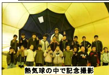
熱気球の中で記念撮影