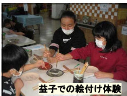
益子での絵付け体験

12月13～15日に2泊3日で、臨海自然教室を実施しました。2日目には、吹上小との合同プログラムも行われ、海の自然を満喫しながら、交流することができました。