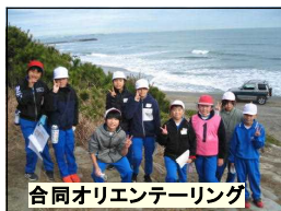
合同オリエンテーリング