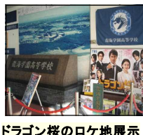
ドラゴン様のロケ地展示