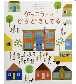
がっこうだって どきどきしてる