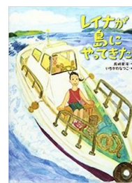
レイナが 島にやってきた!