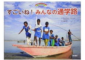
すごいね! みんなの通学路