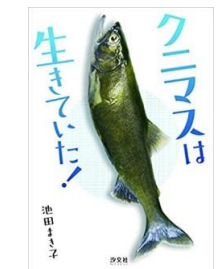
クニマスは生きていた!

今年度の課題図書が決まりました。いつも自分が選ぶ本とは違う本を読んでみるよい機会です。いまのうちから何冊か読んでみて感想文が書けそうな本を選んでおくのもいいですね。