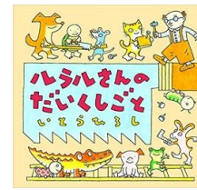
ルラルさんの だいくしごと