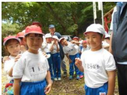
(みんなでゲームをしました。)