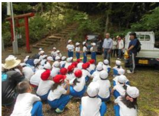
(地域の方のお話を聞きました。)