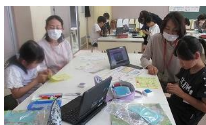
【5年生家庭科ボランティア】