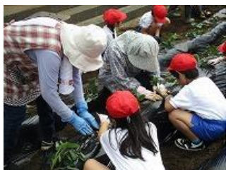
【1・2年生サツマの苗植え】