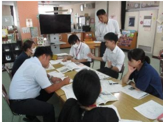
【指導案検討会の様子】

夏休み中、職員は、研修と作業なども行いました。4・5・6年生が4月に受けた国や県のテスト結果の分析と今後の指導についての協議や、2学期に行う研究授業のための指導案検討会、学級全体への指導や個に応じた指導を適切に行うためのQ-Uテストの分析や児童理解の研修、藤岡地区の小中学校の教職員による合同研修会、外部団体主催の各種研修会参加等、校外外で様々な研修を行い、教職員の資質・能力の向上を図りました。また、全ての教室のカーテンの洗濯、特別教室や倉庫などの片付けと大掃除をし、きれいになって子供たちを迎えることができました。