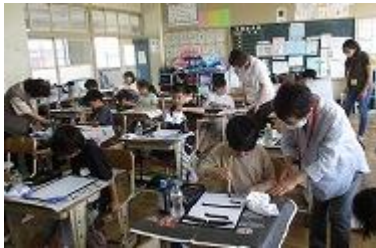
【3年生書写ボランティア】