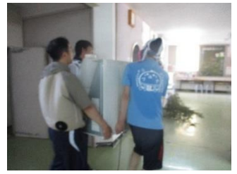
【不要物の片付け作業】