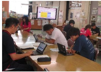
【働き方改革のための研修】