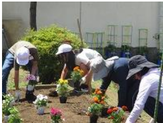
【環境委員との花壇整備】

1学期、様々な教育活動で、保護者や地域ボランティアの皆様にも、大変お世話になり、ありがとうございました。2学期もよろしくお願いいたします。