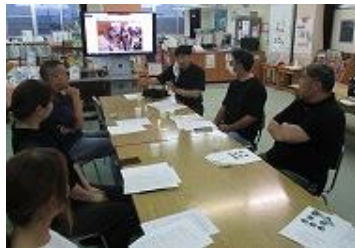
【あかまっ子体験フェスタあかまる隊会議】