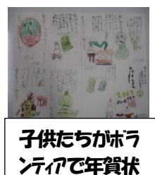
子供たちがボランティアで年賀状書きをしました