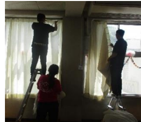
【洗濯したカーテンの取り付け】