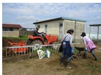
【サツマを植える畑づくり】