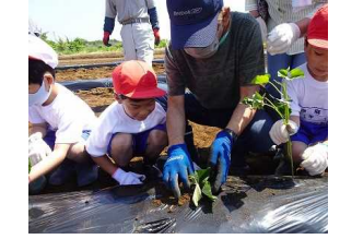
【ボランティア感謝会／感謝の言葉・感謝状贈呈・各学年の発表】 【読み聞かせボランティア】 【サツマイモ苗植え・収穫ボランティア】