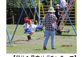
【ミシンボランティア】 【稲刈りの場のご提供とやり方のご指導】 【花壇整備ボランティア】 【白衣ボランティア】 【昼休み見守りボランティア】