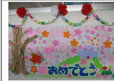
ボランティア様、在校生、先生方から