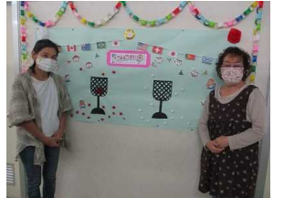
【ヨシ灯りボランティア】 【あかまる隊・ヨシ灯り点灯】 【コロポックル・人形劇ボランティア】 【登下校見守りボランティア】 【折り紙・掲示ボランティア】

保護者の皆様、地域の皆様に支えられ、この1年間を無事終了することができました。どうぞこれからも、赤麻小学校、そしてあかまっ子たちを温かく見守ってください。よろしくお祈りします。1年間お世話になりました。