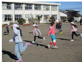
【人権週間・掲示コーナー】