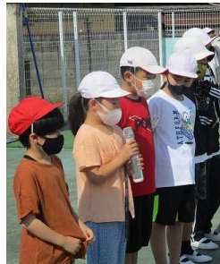
【プール開きでは各学年の代表者が目標を発表】