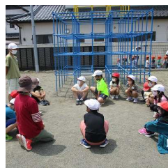
【縦割り班で自己紹介】