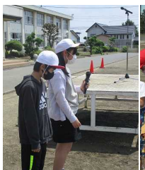
【企画委員会進行】【1年生へのインタビュー】

5月24日（火）、「1年生を迎える会」が行われました。1年生と上級生が交流し、今後1年生が楽しく学校生活を送れるようにすることが目標です。今年も企画委員会の6年生の司会進行により、1年生へのインタビュー（名前と好きな物）、縦割り清掃班による遊び（感染防止対策がとれる遊び）、1年生へのプレゼントなどが行われました。1年生は全員がインタビューに答え、名前や好きな物を発表することができました。終了後の感想も「楽しかった」「うれしかった」という答えが返ってきました。「これからも楽しく学校に来られそうですか？」という校長の問いかけにも、1年生全員が「はい」と応えてくれました。企画委員会や6年生を中心に、上級生たちも1年生を喜ばせようとがんばっていました。これからも1年生は毎日楽しく学校に来てくれることと思います。