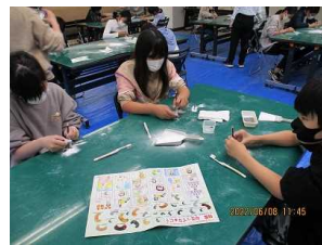
【6年・勾玉作りの体験】