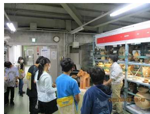
【6年・土器に触れる】