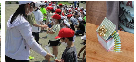
【6年生からびっくり箱のプレゼント】