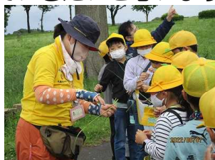
【3年・渡良瀬遊水地】