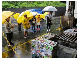
【4年・とちぎグリーンプラザ】

6月6日(月)に4年生、7日(火)に3年生、8日(水)に6年生が校外学習に行ってきました。関東地方が梅雨入りし、4年生はあいにく雨の中での学習になってしまいました。3年生、6年生も雨が心配されていましたが、幸いほとんど影響を受けずに活動できました。4年生は社会科の学習で「とちぎグリーンプラザ」「菌部浄水場」へ、3年生は総合的な学習で「渡良瀬遊水地」「藤岡図書館」「道の駅みかも」へ、6年生は社会科の学習で「しもつけ風土記の丘資料館」「栃木県埋蔵文化センター」へそれぞれ行きました。どの学年の子どもたちも見学や体験を通して初めてわかることを実感したり、新しい発見をしたりできたようです。今後の学習に確実に生かしていきたいと思えます。