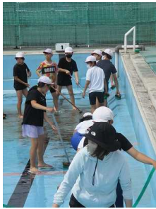
【5、6年生がプールの底も壁もまわりもきれいにしました】

今年も5年生と6年生がプール掃除をしてくれました。プールの中はもちろん、プールサイドの草取りや更衣室の清掃もしてくれました。また、教職員もこの清掃への参加はもちろん、事前に心肺蘇生等、救急救命のための研修を行い、水泳学習の開始に備えました。そして、6月3日（金）、2年生が先陣を切ってプールに入りました。この日は続いて5年生、6年生も入りました。今年もプールに入れる喜びを十分に味わい、有意義な水泳学習をしてもらいたいと思います。