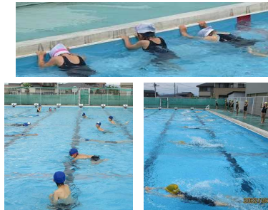
【間隔を十分とって2、5、6年生が初泳ぎ】