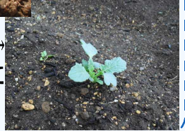
種まき20日後。→葉っぱが、ぎざぎざになってきました。