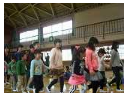
笑顔いっぱい赤麻っ子たち(1年生を迎える会より)