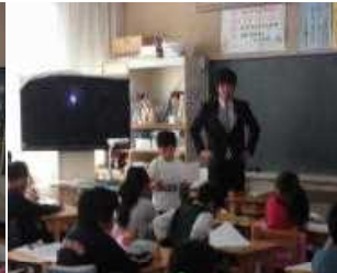
3年生 国語 「つたえよう 楽しい学校生活」