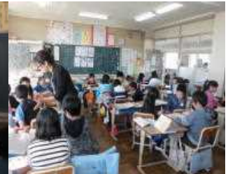
4年生 道徳 「情報モラル」