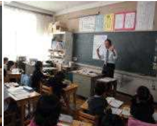
2年生 算数 「かけ算」