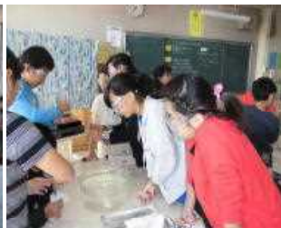
6年生 理科 「水溶液の性質」