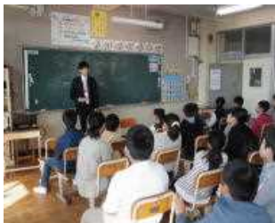
5年生 外国語活動 「できることを 紹介しよう」