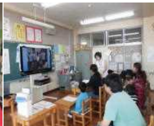
チャレンジ1・2 生活単元 「発表会」