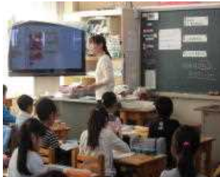
1年生 算数 「3つのかすの たしざん・ひきざん」

10月15日(土)に家族授業参観とPTA主催のあかまっ子祭バザーを実施しました。当日は、お忙しい中、多くの保護者や祖父母の方に授業参観していただき、ありがとうございました。子どもたちは、朝からとても嬉しそうで、1年生の教室からは「今日はおじいちゃんも来るんだよ!」「うちはおばあちゃん来るよ!」などの声が聞こえてまいりました。下記の写真は、2時間目の家族授業参観風景です。