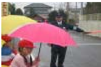
1年交通安全指導教室