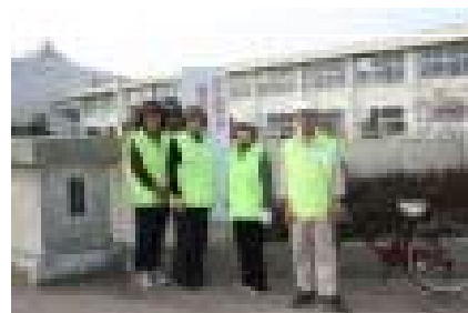
下校見守りの皆さん