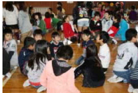
いきいき赤麻っ子たち（1年生を迎える会より）