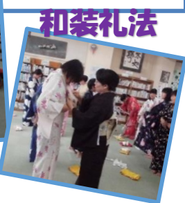
お届け物を風呂敷で包んでみましょう。