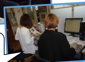
レイアウトはこれでいいかな？