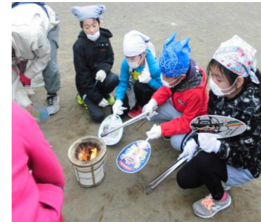
11月22日 昔の暮らし体験

11月22日には、昔の暮らし体験を行いました。昔の生活に思いを馳せながら、毎日苦勞しながら生活をしていたことを実感しました。また、11月28日には、栃木市を巡り、歴史の息づく文化を体感してきました。現代の世の中と比較しながら、社会科の学習を通して、学びを深めていってほしいと思ひます。